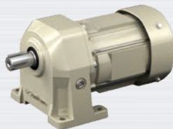
プレスト®NEOギヤモーター 40W ~ 2.2kW