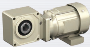
ハイポニック減速機® 15W ~ 11kW

ハイポニック減速機®、プレスト®NEOギヤモーター、アルタックス®NEOに、オプションとして追加可能です。