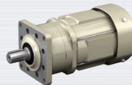
アルタックス®NEO 40W ~ 3.7kW

SIAAマークとは、SIAA (抗菌製品技術協議会) が制定した抗菌のシンボルマークです。 SIAAが制定した「抗菌性」「安全性」「適正な表示」の3つの基準を満たした製品にのみSIAAマークの表示が認められています。